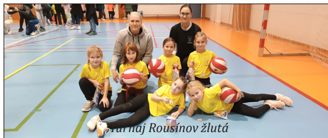
Turnaj Rousínov žlutá