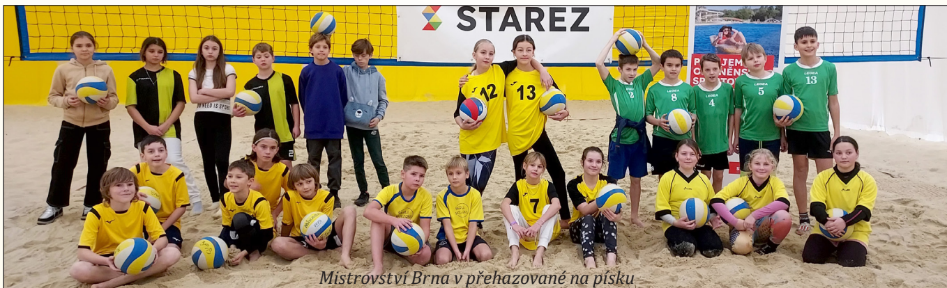
Mistrovství Brna v přehazované na písku