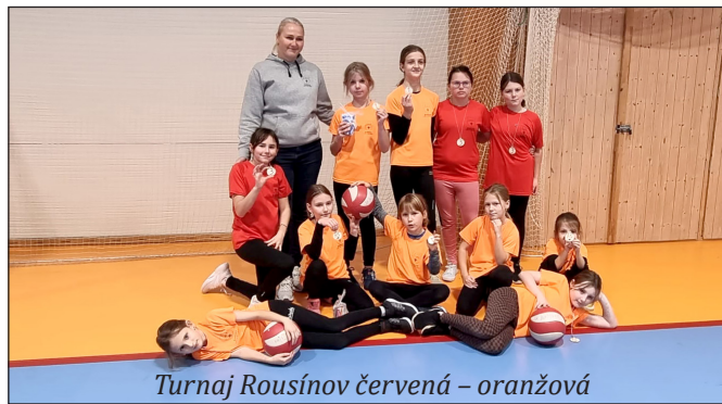
Turnaj Rousínov červená – oranžová