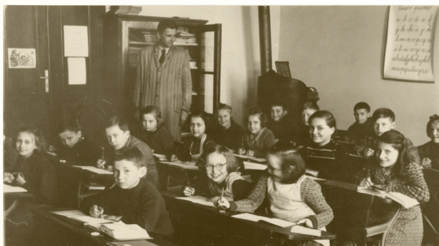
Stará kamna ve škole