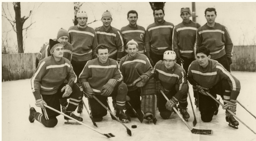
Hokej na Skolském hřišti

kolébalo, než klouzalo a bruslení připomínalo chůzi kačenky. Když už jsme měli „krasobruslařské“ bílé boty nebo kluci „kanady“, to už jsme byli hodně šťastní.