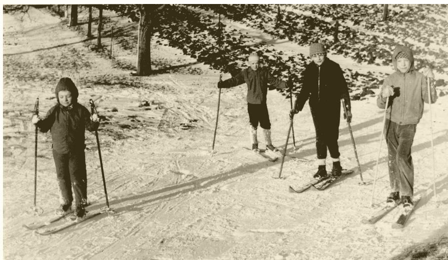
Lyžování za zahradami pod hřbitovem, tzv. „Za dráhó“

My jsme chodili na Sokolské hřiště. Na začátku zimy obětavci postavili mantinely, zavěsili světla, od „zahradníků“ natáhli přes silnici hadici a plochu po nocích napouštěli. Většinou krásně mrzlo, led byl upravený a kluziště bylo zdrojem radostí obyvatel všeho věku. Hned jak se kluziště otevřelo, koupili jsme si permanentku na celou sezónu. Stála asi 5 Kč. V kabinách jsme se přezuli do bruslí a užívali si zimu. Když zavřu oči, vidím před sebou děti a mládež snad z celé dědiny, jak se drží za ruce a tento dlouhý had projíždí celé kluziště při hře „na rybičky“ a vzpomínka na pokřik „Lóvte se, rybičky, velký i maličký...“ mi dodnes vyvolává úsměv na rtech. Když jsme byli ještě hodně malí, bruslili jsme na takzvaných „kačenkách“. Ty se připevňovaly na boty řemínky nebo se připevňovaly pomocí kličky. Na ledě se na nich spíš