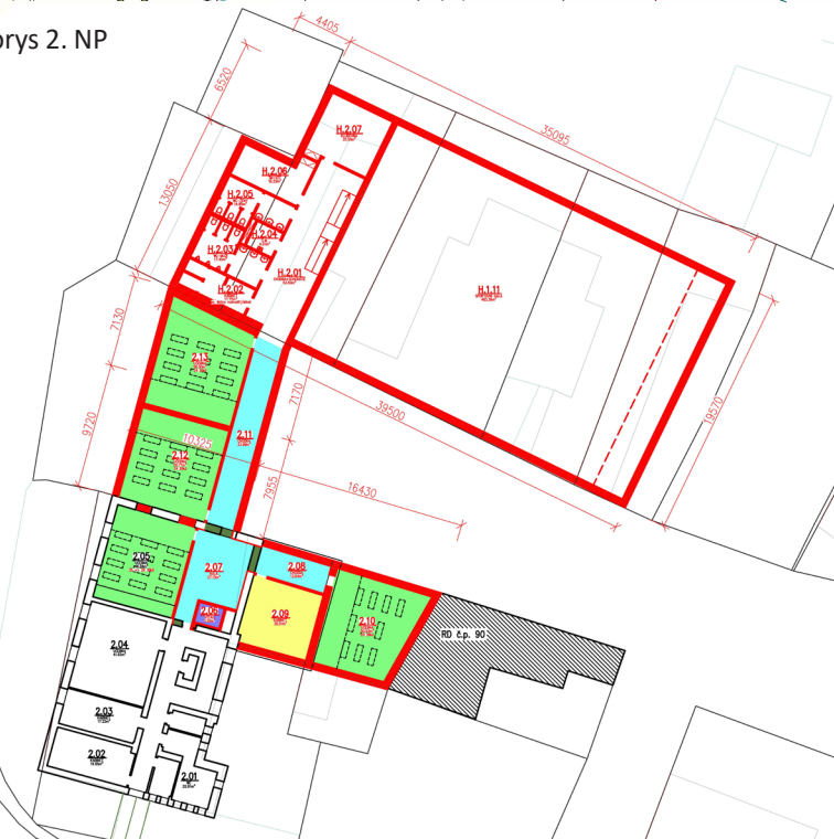
Půdorys 2. NP