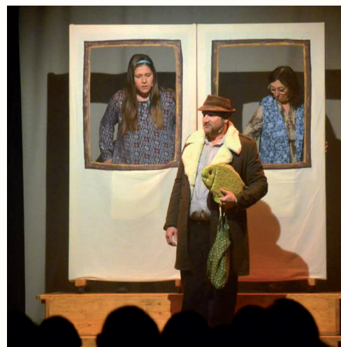
Divadelní představení „Jak jsem se ztratil“ 15. prosince 2024