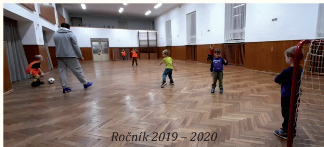
Ročník 2019 – 2020