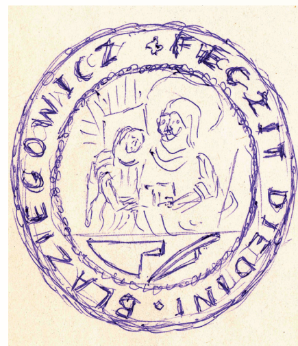
Původní pečeť obce Blažovice ze Zemského archivu