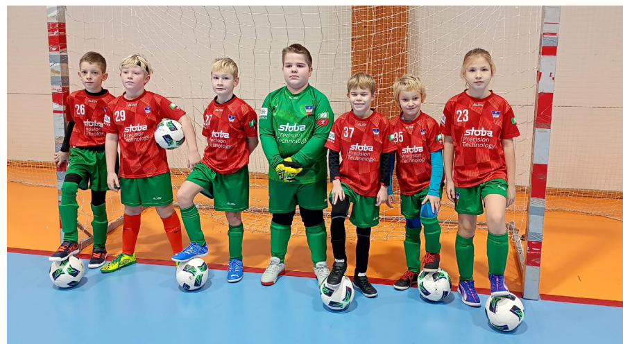
Turnaj v Rousínově (více foto na skblazovice.cz)

19. 1. 2025 Velké Pavlovice – 2. místo z 8 družstev: Velké Pavlovice, Kobylí, Bořetice, Klobouky