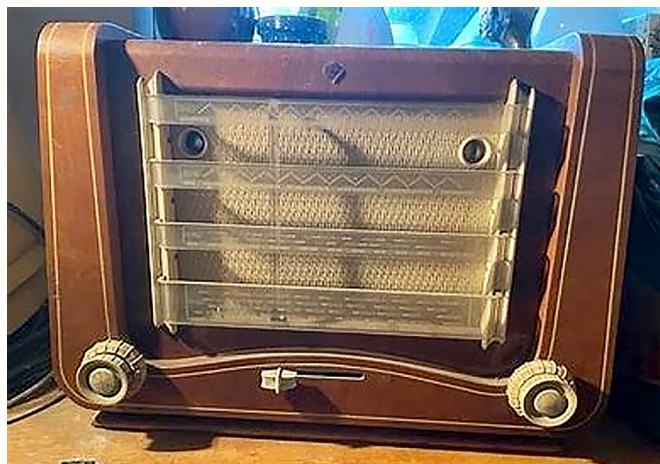
Nepříliš historická čtyřlampovka Tesla mně ještě hraje, ale stanice, které bych mohl poslouchat již vysílají na nových „frekvencích“

Abych se nezabýval jen rádiem, jakoby jediným producentem řeči a muziky, musím vzpomenout, kam až za-