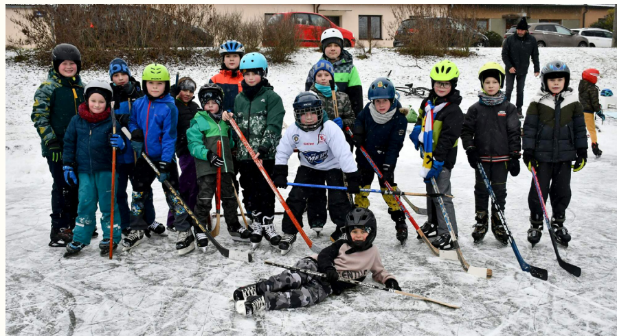
Trénink na zadním rybníku

u Brna, Hustěnovice, Borský Svätý Jur (SK), Kobylnice, Blažovice. Děti si poprvé zkusily jaké je to hrát na turnaji o dvou skupinách, z každé skupiny postupovalo jen první a druhé družstvo. Ve vyřazovací části o našem postupu do finále rozhodl penaltový roztřel, který dětem přinesl spoustu napětí a následnou eforii z postupu do finále.