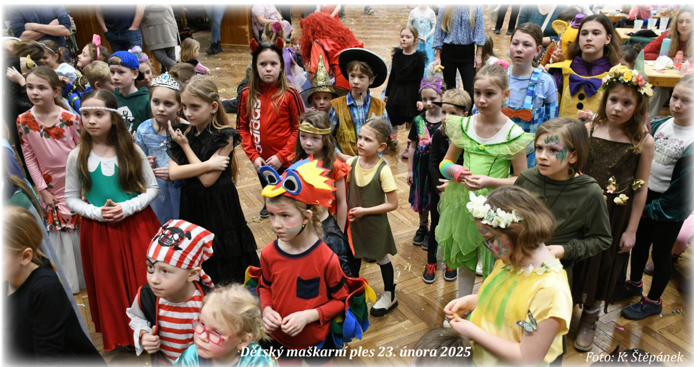
Dětský maškarní ples 23. února 2025